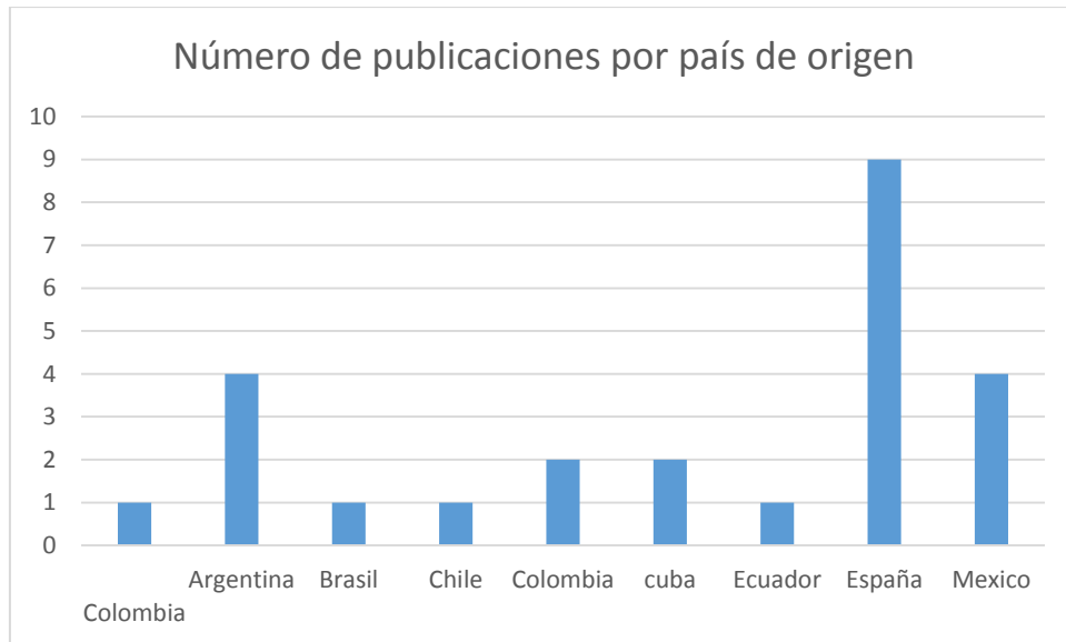
Figura 2. Número de publicaciones por país de origen