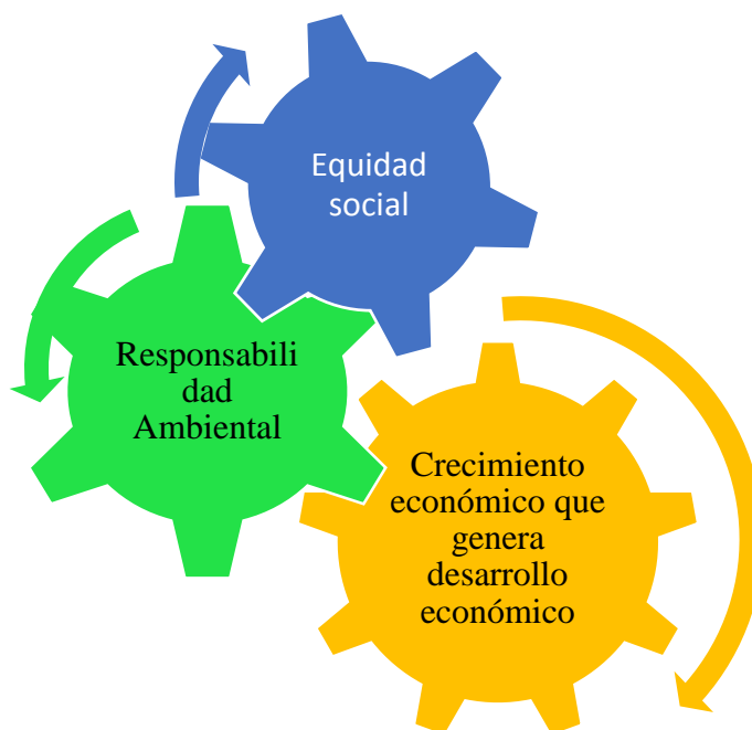
Figura 2. Desarrollo económico

También, comprendieron que la explotación de cualquier actividad agropecuaria debe generar un equilibrio perfecto entre el desarrollo, el crecimiento económico, la equidad social y la responsabilidad con el medio ambiente, tal como se muestra en la figura 5. Si este equilibrio se da en debida forma, la explotación avícola generará un desarrollo humano sustentable y sostenible para la región (Gestiopolis, 2010).