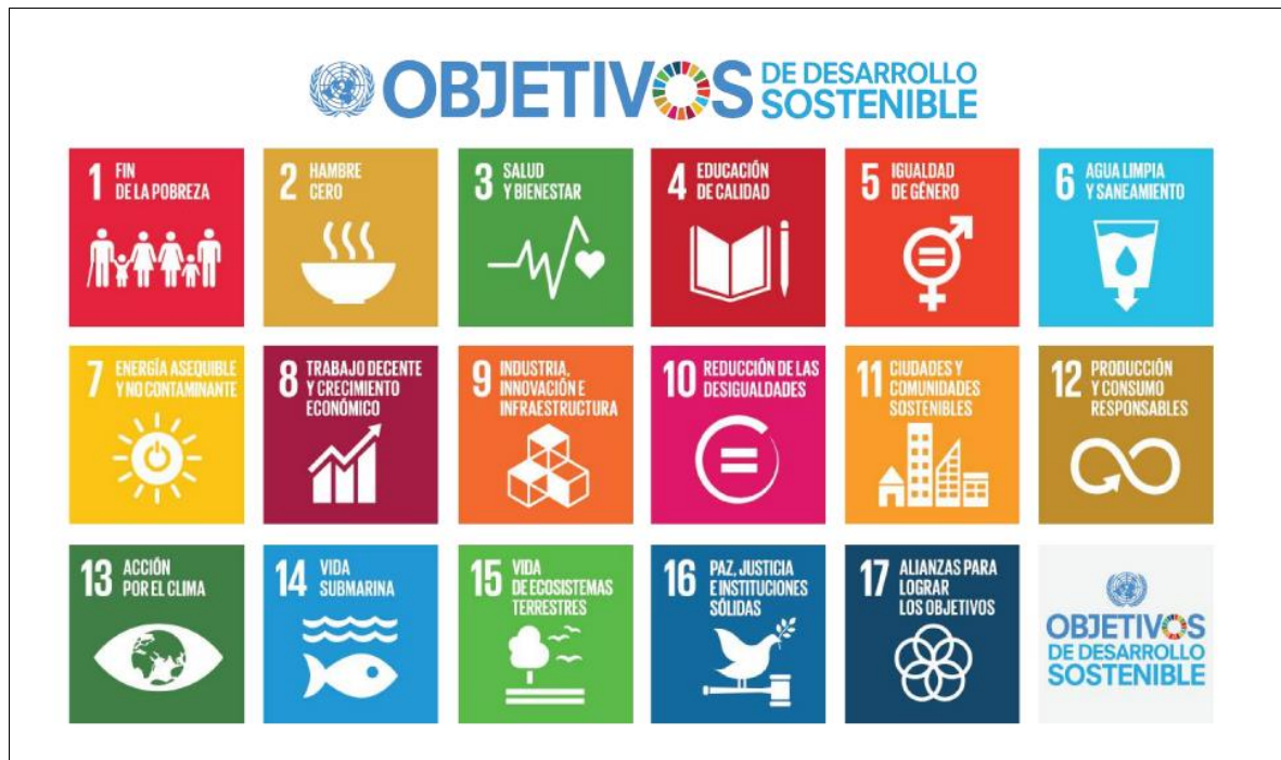
Figura 1. Objetivos de desarrollo sostenible