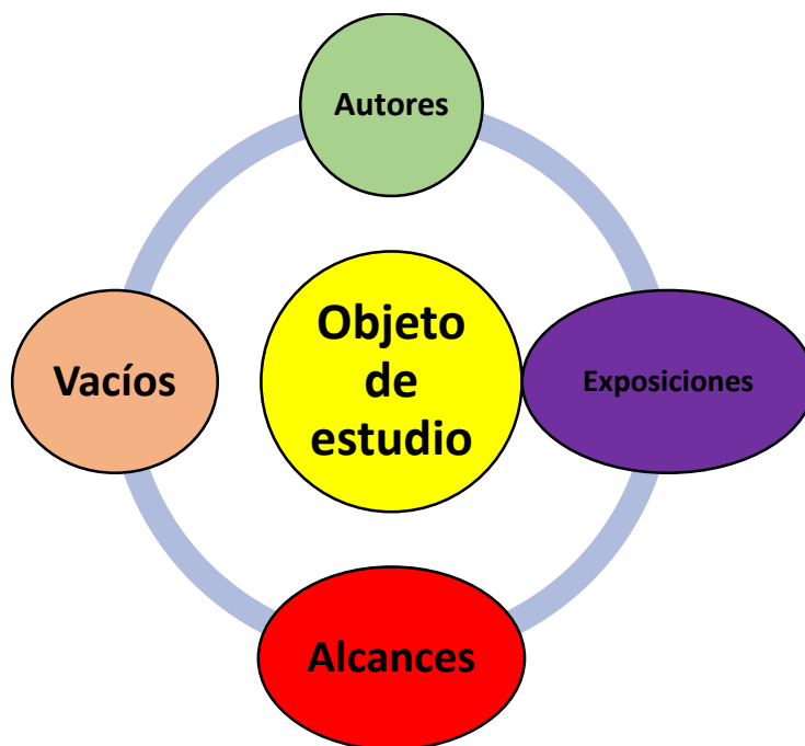
Gráfica N°1 Objeto de estudio

Tal como se indicó, dentro de este apartado se construirá el objeto de estudio de la investigación, con lo cual se analizarán los alcances de las diferentes investigaciones que abordan el tema en cuestión, asimismo, se podrá detallar todo lo que los diferentes doctrinantes han recopilado en cuanto al tema de la violencia en Colombia, de esta forma, se llegará a plantear una fisura epistemológica de investigación.