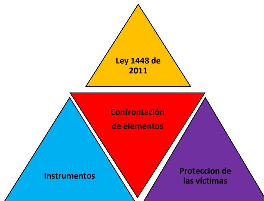
Gráfica N°3 Confrontación de elementos